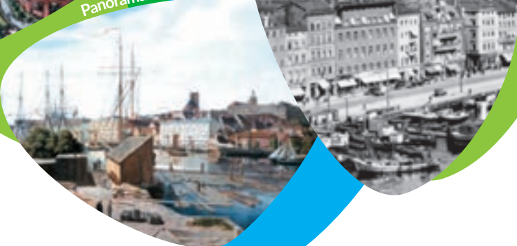
Panorama miasta – 1836 r.

uzyskuje nowoczesny kształt urbanistyczny. W latach 1902-1921 powstają monumentalne Tarasy Hakena (dzisiejsze Wały Chrobrego). Po zakończeniu I wojny światowej następują lata trudne dla szczecińskiego portu i przemysłu. W 1940 r. utworzono „Wielki Szczecin”, łączyąc w obszar miejski okoliczne wsie i miasteczka (Dąbie, Police). W okresie II wojny światowej gospodarka Szczecina zostaje podporządkowana potrzebom militarnym III Rzeszy. W latach 1943-1945 alianckie naloty dywanowe niszczą większą część miasta, w tym port i stocznie. W 1945 r. Szczecin zostaje zdobyty przez Armię Czerwoną. Po konferencji poczdamskiej miasto zostaje przyznane Polsce. Wprowadzona zostaje polska administracja, równoległe funkcjonują niezależne enklawy zajmowane przez wojska sowieckie. Dopiero w 1955 r. polskie władze przejmują od władz radzieckich ostatnią część portu. Zniszczenia wojenne, niepewna sytuacja polityczna, demontaż infrastruktury przemysłowej utrudniają i opóźniają odbudowę miasta. W grudniu 1970 r. wybuchają protesty robotnicze przeciw komunistycznym władzom, które zostają brutalnie stłumione. W sierpniu 1980 r. po fali strajków w Stoczni Szczecińskiej zostają podpisane „Porozumienia Sierpniowe” między zakładowym Komitetem Strajkowym a władzami PRL. W grudniu 1981 r. wprowadzony zostaje stan wojenny. W 1988 r. wybuchają strajk, który doprowadza do obrad Okrągłego Stołu. W 1990 r. odbywają się pierwsze demokratyczne wybory do Rady Miejskiej.